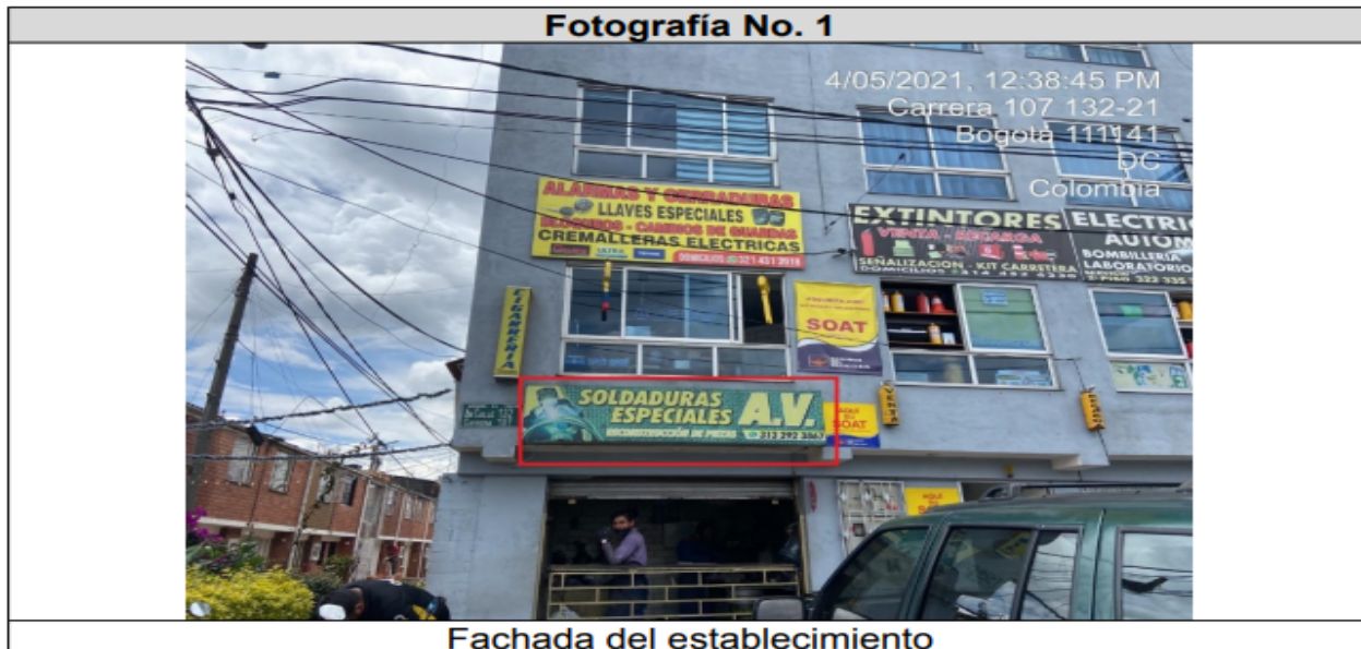
Fotografía No. 1

5. EVALUACIÓN TÉCNICA En la siguiente tabla se relacionan los hechos observados durante la visita técnica que evidencian el presunto incumplimiento frente a la normatividad vigente.